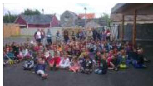
Remise des prix à l'école du Crotoy