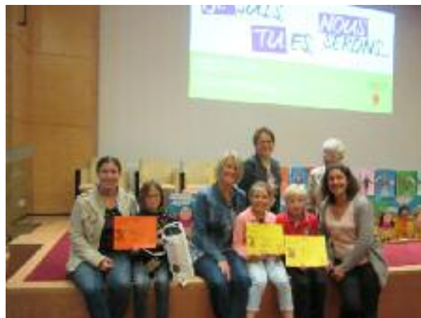
Nos lauréats à la remise des prix nationale à Paris

Après cette moisson de récompenses, il ne reste plus à tous ces écrivains en herbe, qu'à réfléchir au thème de l'année prochaine : « On ne naît pas citoyen ou citoyenne, on le devient ».