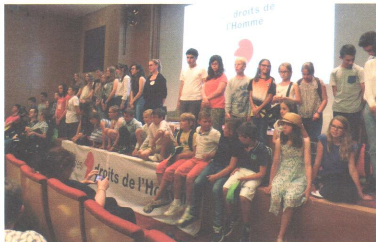
Remise de prix du samedi 17 juin 2017, grand amphithéâtre de la MGEN, Paris.

African Safari ; aquarium de La Rochelle ; aquarium du Grand Lyon ; aquarium Sea Life ; Bergerie nationale ; château de Chambord ; château de Cheverny ; château de Clos Lucé ; cinémas MK2 ; cirque d'hiver Bouglione ; Cité de l'espace ; Cité des sciences et de l'industrie / Palais de la découverte ; les éditions : Albin Michel jeunesse, Anne Carrière, Casterman, de l'Atelier, École des loisirs, Gallimard jeunesse, Hachette jeunesse, Martinière jeunesse et le Seuil, Le Cherche Midi, Lito, Rue du monde, Sarbacane, Tonkam ; espace Rambouillet ; Fondation Lilian Thuram www.thuram.org ; Gibert Joseph ; le Grand Palais ; Jardin des plantes ; Journal des enfants ; La Cité de la mer - Cherbourg ; La vallée des singes ; Le Monde ; Le parc de la Belle ; L'Étudiant ; Lulu Castagnette ; Marineland ; Micromania ; Musée de Cluny ; Musée de la poupée et du jouet ancien ; Musée de la poupée ; Musée des miniatures et décors de cinéma ; Musée du quai Branly ; Musée gallo-romain de Lyon / Parc archéologique ; Palais des glaces ; Parc mini-châteaux / Grand aquarium de Touraine ; Pilot Europe S.A. ; Réserve africaine de Sigean ; Terre de singes ; Touroparc zoo ; zoo La Palmyre