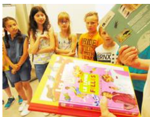
Remise des prix aux lauréats dont : (voir photo de droite)