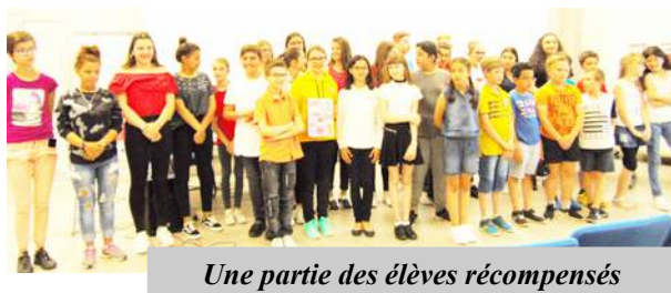
Une partie des élèves récompensés

Grâce à l'engagement et au dynamisme de nombreux enseignants, 67 œuvres ont été présentées pour participer à cette belle initiative pour la fraternité.