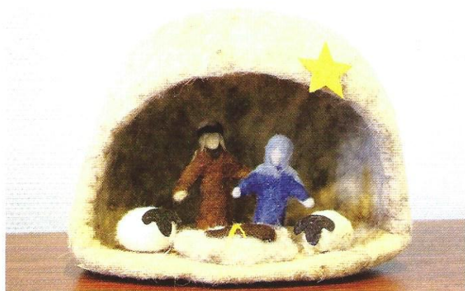
Crèche en feutrine exposée à l'entrée de l'Hôtel de Ville

Que l'on croit au Ciel ou non, chacun fête Noël à l'origine de la chrétienté. Ce n'est pas que des sapins lumineux, des guirlandes dans les rues, des repas, des cadeaux et des jours de congés payés. C'est avant tout une fête chrétienne avec la naissance de Jésus, fils de Dieu.