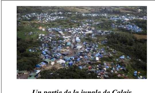
Un partie de la jungle de Calais

Sur ces actes de barbarie, sur ce qu'ils entraînent comme décisions à prendre par ceux qui gouvernent notre pays, sur le difficile équilibre à trouver entre sécurité des citoyens et respect des libertés, sur les risques de dérives possibles si nous n'y prenons pas garde, la ligue des Droits de l'Homme s'est exprimée, et son message rendu public. Je ne peux ici, que saluer la détermination,