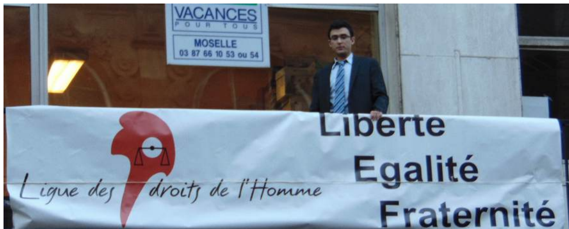
Banderole au balcon du 3, rue Gambetta

J'exprime ma gratitude à tous ceux qui ont agi et continuent de le faire pour soigner, soutenir les victimes des crimes. Je soutiens le fait qu'il faut se protéger et mettre hors d'état de nuire les assassins et leurs commanditaires. Autant je rejette l'idée de la loi du talion et de la vengeance autant je reconnais le principe essentiel de la légitime défense. Les forces de sécurité doivent être soutenues et il est important que la nation leur exprime notre reconnaissance en même temps qu'elles doivent porter très haut les valeurs de notre République.