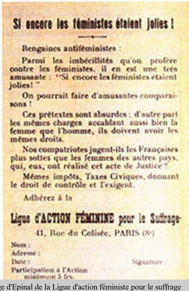
Image d'Epinal de la Ligue d'action féministe pour le suffrage

http://www2.assemblee-nationale.fr/decouvrir-l-assemblee/histoire/le-suffrage-universel/la-conquete-de-la-citoyennete-politique-des-femmes/contre-le-vote-des-femme