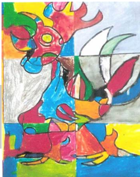
Dessin réalisé par les élèves de l'école de Behren

http://site.ldh-france.org/metz/2016/05/12/ecrits-pour-la-fraternite/