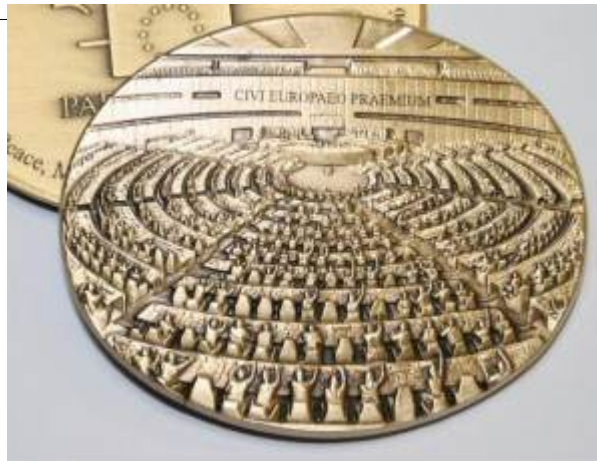
Médaille du citoyen européen

http://site.ldh-france.org/metz/category/chomage/