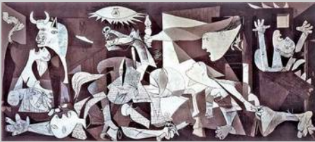
« Guernica » Pablo Picasso 1937

La Ligue des Droits de l'Homme de Moselle