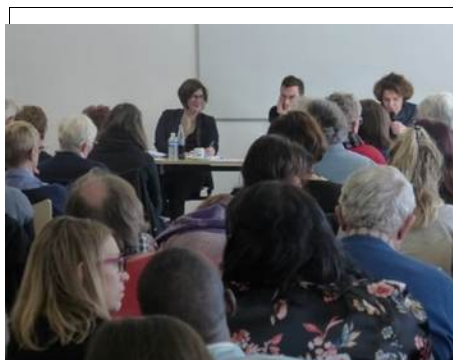
Les intervenants de face sur la photo