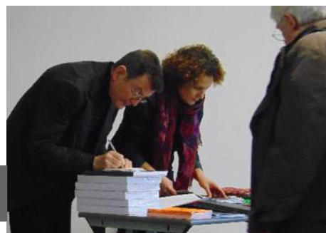
Les documents édités par la Gisti sont vraiment d'un usage précieux