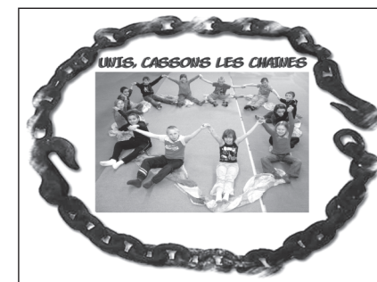
Œuvre collective 2010 CLISS d'Orchies