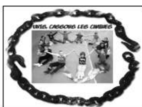
Œuvre collective 2010 CLISS d'Orchies

Site Internet de la L.D.H. nationale : www.ldh-france.org