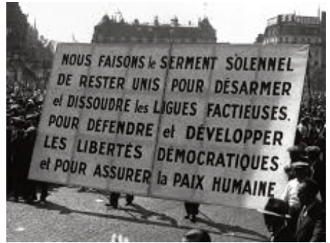
Serment du Front Populaire 14 juillet 1935

Animateur : Bernard Petit (Mouvement de la Paix)