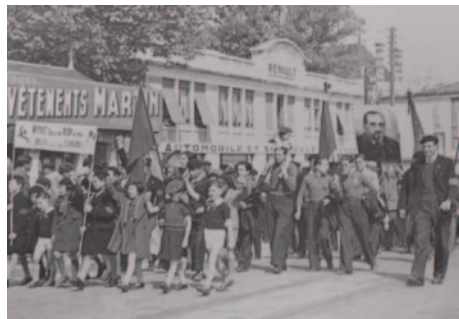
1 er mai 1937 à Saintes en soutien aux Républicains espagnols